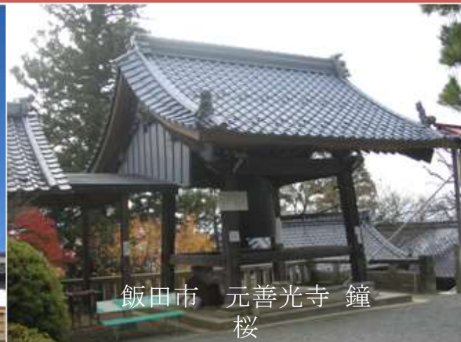
飯田市 元善光寺 鐘 桜