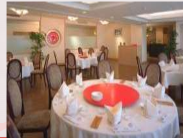
中華レストラン 「杏苑」

現在、一般客室に加え、国の登録有形文化財を客室「豊年虫」としてご利用いただいております。 また、日本における中華料理の祖「陳建民」の流れをくむ、中華料理をお昼・夜レストラン「杏苑」としてご利用いただいております。