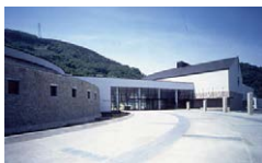
長野県立歴史館外観

常設展示室は原始から現代までたどれる展示で、ナウマンゾウ、縄文のムラ、鎌倉時代の善光寺門前、江戸前期の農家、明治初期の製糸工場など、時代ごとの人びとの生活を体験できるようになっていて、臨場感あふれる実物大の展示が楽しめます。