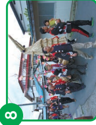
8 大長の水神祭 中野市