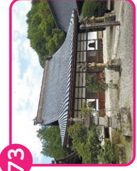
24 正福寺(千人塚) 上田市