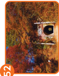
52 旧国鉄篠ノ井線廃線敷 安曇野市