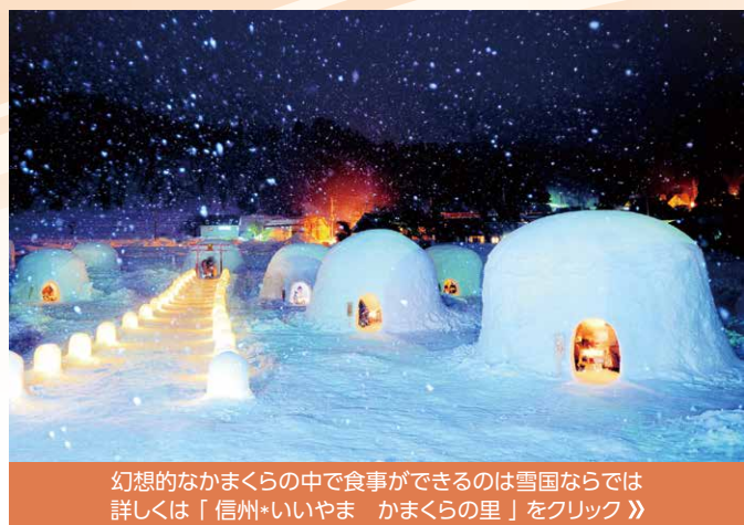
幻想的なかまくらの中で食事ができるのは雪国ならではの 詳しくは「信州+いいやま かまくらの里」をクリック》

食を生かした観光誘客に力を入れています。「地域のおいしい食を味わうと、また来たいと思うきっかけになる」と高田局長。また、周遊観光をサポートするツールとして志賀高原を起点にしたガイドマップや、そばやスイーツに特化したマップを作成。「せっかく来ていただいたのに、1カ所だけで帰ってしまうのは残念」とさまざまな選択肢を提案しています。