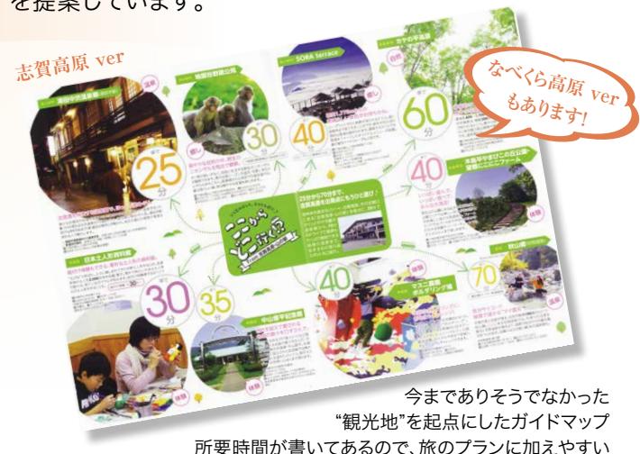
今までありそうでなかった “観光地”を起点にしたガイドマップ 所要時間が書いてあるので、旅のプランに加えやすい