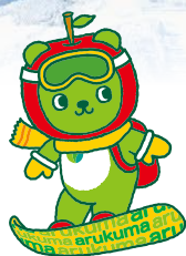
長野県PRキャラクター 「アルクマ」 ©長野県アルクマ