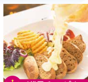
4代目チャンピオン