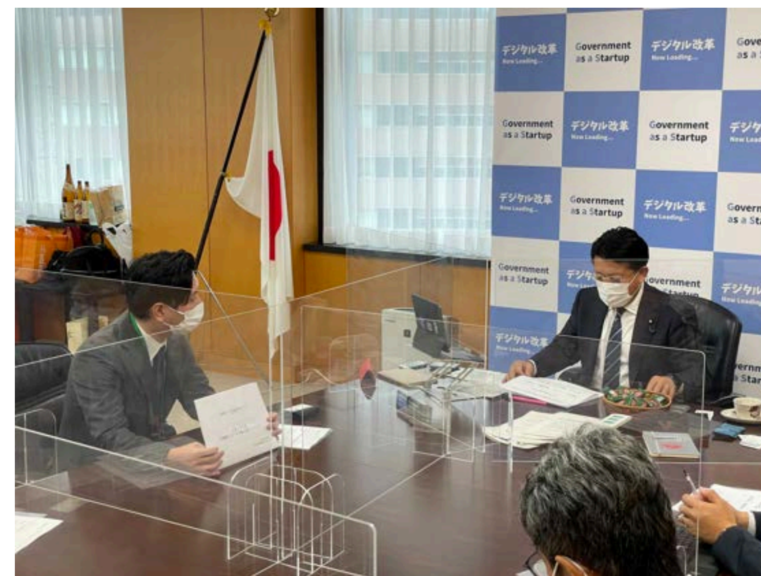
クラウド型電子署名サービス協議会の設立