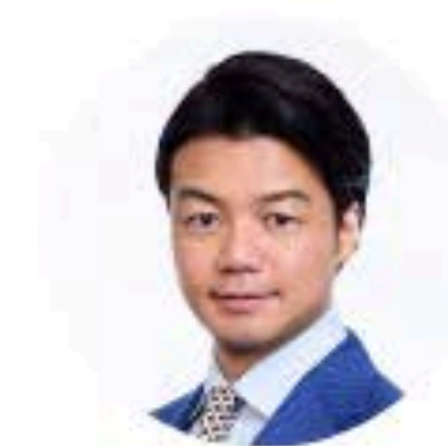
創業者 代表取締役社長 弁護士