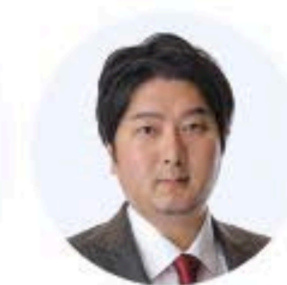
取締役 クラウドサイン事業責任者 弁護士