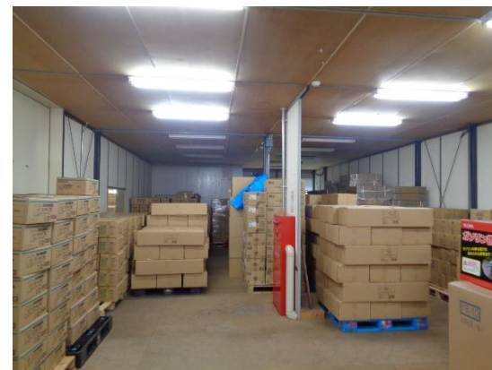
長野県松本平広域公園内防災倉庫(松本市)