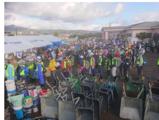
令和元年東日本台風災害時のボランティア活動(長野市内)