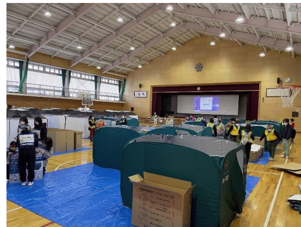
長野県総合防災訓練における避難所開設・設営訓練(駒ヶ根市)

令和3年8月、9月の大雨災害において、 茅野市、王滝村 の住民の避難先としてホテル・旅館等を活用