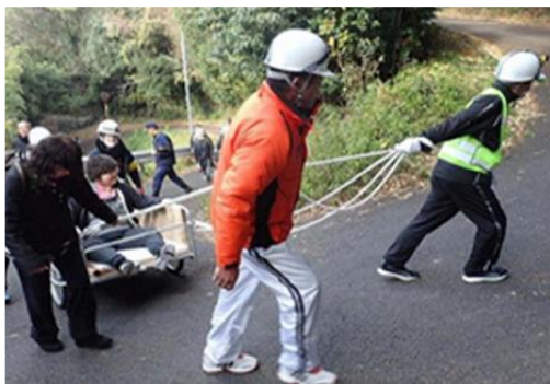
避難行動要支援者が災害時に避難する際のイメージ